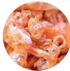
Сушеный оболочки креветки